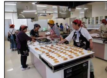
食工房（茶がゆ・三笠焼）