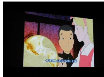
映画「ジョバンニの島」