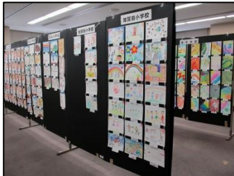
人権ポスター作成展示