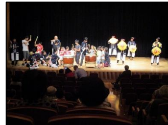
和太鼓（河南高校地車）